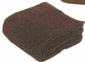
Copriletto color castagna, Nettare di Fazzini € 195.

CHIC E SENZA TEMPO: IL COLORE DEL LEGNO CHIARO DÀ ALLA CASA UN TOCCO CALDO. CHE INVITA AL RELAX di FRANCESCA BOCCADORO