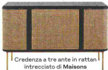
Credenza a tre ante in rattan intrecciato di Maisons du Monde € 699.

"VIVO" E OSPITALE Colori coloniali, materiali naturali e linee semplici: in un soggiorno così, che attira la luce e richiama lo stile nordico, rilassarsi è un attimo. Per aggiungere carattere, una maxi libreria, cuscini, vasi à gogo (su westwingnow.it ).