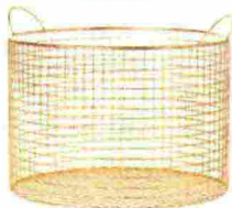
Contenitore in metallo dorato di H&M Home € 14,99.