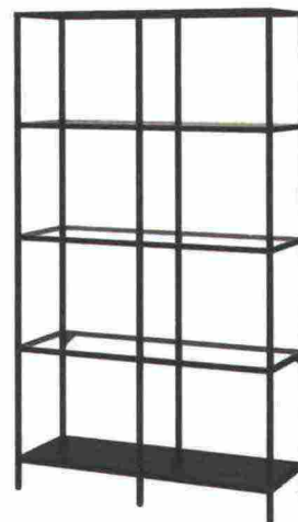
Scaffale con ripiani in vetro (100x175 cm) di Ikea € 195.