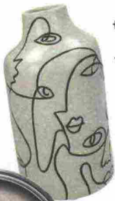
Vaso in terracotta di HD collection su westwingnow.it € 20,99.