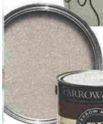
Smalto per mobili interni ed esterni "cornforth white" di Farrow & Ball € 156.