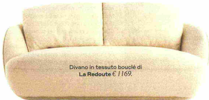
Divano in tessuto bouclé di La Redoute € 1169.