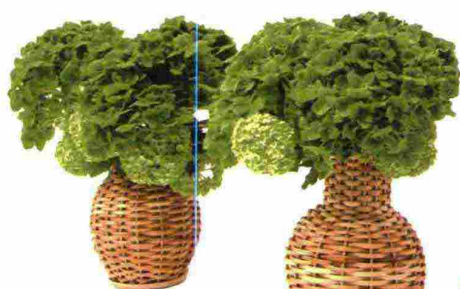
VASI Natural Wicker Vase [Mrs. Alice € 49,36 il set da 3].