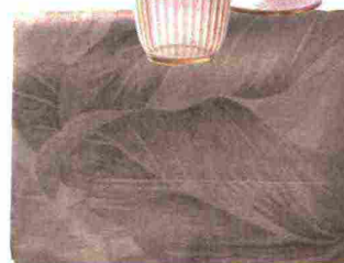
TOVAGLIA Foliage, 65% lino e 35% cotone [Fazzini cm 180x290 € 179].