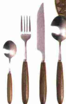
POSATE in legno con impugnature noce Feast [Serax su » madeindesign.it € 184 per 24 pezzi].