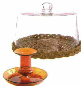
PORTACANDELA in vetro borosilicato, Ambra [Hay su » smallable.com € 36].