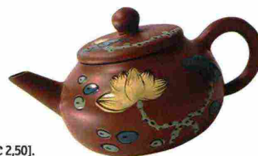
TEIERA Flower in argilla, fattura artigianale [Arte del Tè € 45].