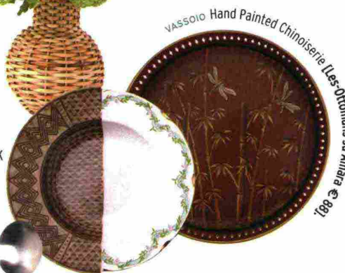
VASSOIO Hand Painted Chinoiserie [Les Objets su Amara € 89].