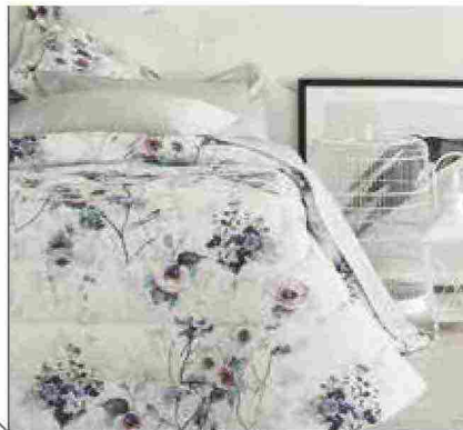
● Patchouli , stampa delicata su percalle di cotone. www.dondi.it