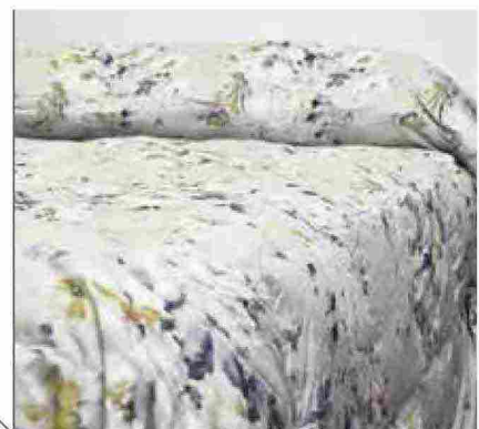
● Elite Canazei , in cotone e imbottitura in piumino. www.daunex.it

Ritaglio stampa ad uso esclusivo del destinatario, non riproducibile.