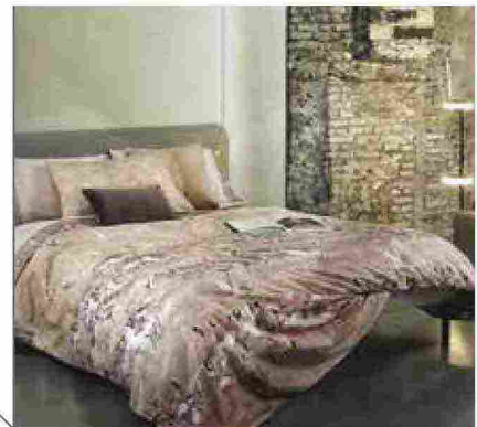
● Pink Africa , in cotone percalle con stampa esotica. www.fazzinihome.com