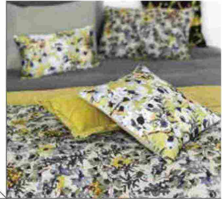
● Hortense , plaid imbottito in cotone e velluto. www.vivaraise.fr