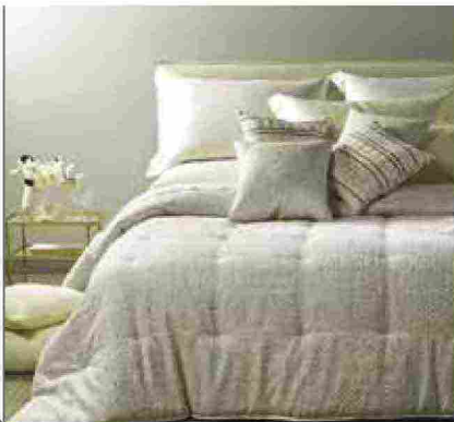
● Smeralda , in raso jacquard, imbottitura in poliestere. www.caleffionline.it