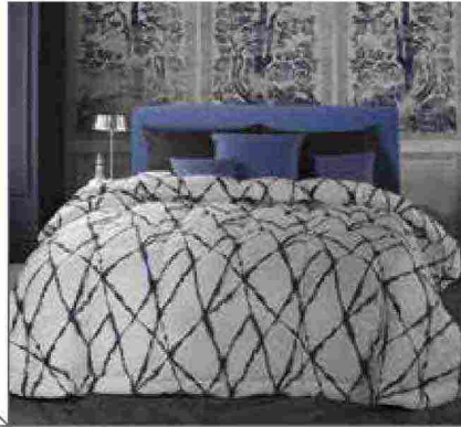
● Basic-Top , in piumino d'oca anche in versione light. www.cinellipiumini.it