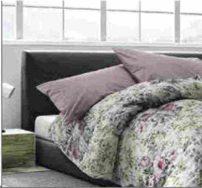
● Trapunta in piuma , traspirabile con tessuti pregiati. www.daunenstep.com

IN GRADO DI DONARE UN SONNO PIACEVOLE. LE TRAPUNTE VALORIZZANO LO STILE DELLA CAMERA CON FILATI PREGIATI O TESSUTI COLORATI