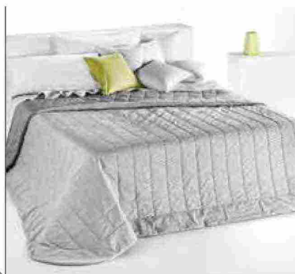
● Tintoinfilo , imbottitura leggera e cotone filo tinto. www.nordpiumini.it