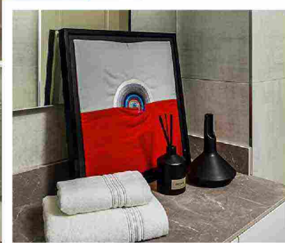
La zona pranzo si affaccia sulla cucina. L'opera è uno studio di Carmi . Nella semplicità del bagno spicca il multiplo d'autore di Carmi

valorizzati. «Volevo che il sapore classico della casa tornasse a splendere, ma nello stesso tempo desideravo contaminare gli ambienti con dettagli di modernità. Per questo abbiamo deciso di lavorare con colori neutri e rassicuranti, in cui inserire