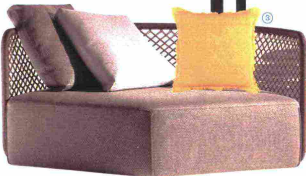
Da esterno la SEDUTA modulare T-Pad [Twils, cm € 146x146x106h prezzo su richiesta].