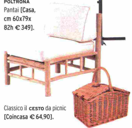
Classico il CESTO da picnic [Coincasa € 64,90].

Immersi nella natura... anche in casa! Con mobili in&outdoor in legno, intrecci naturali e comode sedute