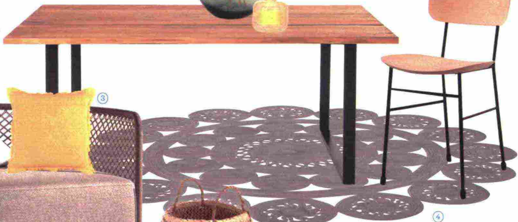
Versione in legno naturale per la SEDIA Master [Midj, cm 40x48x76h da € 387].