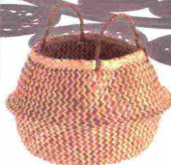
Artigianale il CESTO Meja [Bloomingville su Westwing, ø cm 30x34h € 35].

Ritaglio stampa ad uso esclusivo del destinatario, non riproducibile.