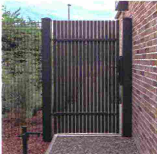
CANCELLO della linea Classic 10.76 in nero opaco [Wiśniowski].

Per gli spazi esterni, si a rivestimenti che non siano solo resistenti ma anche d'impatto. E in armonia con la casa.