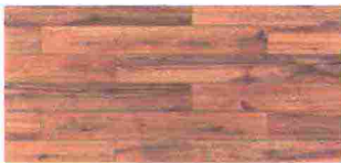
RIVESTIMENTO effetto legno Planches Noisette [Florim, da cm 20x120].