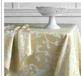
▲ Lusso sartoriale Nata per il mondo dell'ospitalità, la collezione La Suite by Sommal867, 100% made in Italy e improntata al bespoke, arreda anche yacht, spa, ristoranti e sale da pranzo private

Ritaglio stampa ad uso esclusivo del destinatario, non riproducibile.