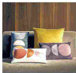
▲ Geometrie dal Perù I cuscini decorativi in velluto della collezione Nazca di Fazzini reinterpretano con la tecnica del ricamo i misteriosi segni che attraversano l'altopiano peruviano