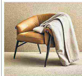
▲ Caldo relax A sinistra, il plaid Cashmere & Suede è in cashmere con bordo in pelle scamosciata, come i cuscini. Sopra, la coperta Tuileries con un motivo a spina di pesce. Tutto di Frette